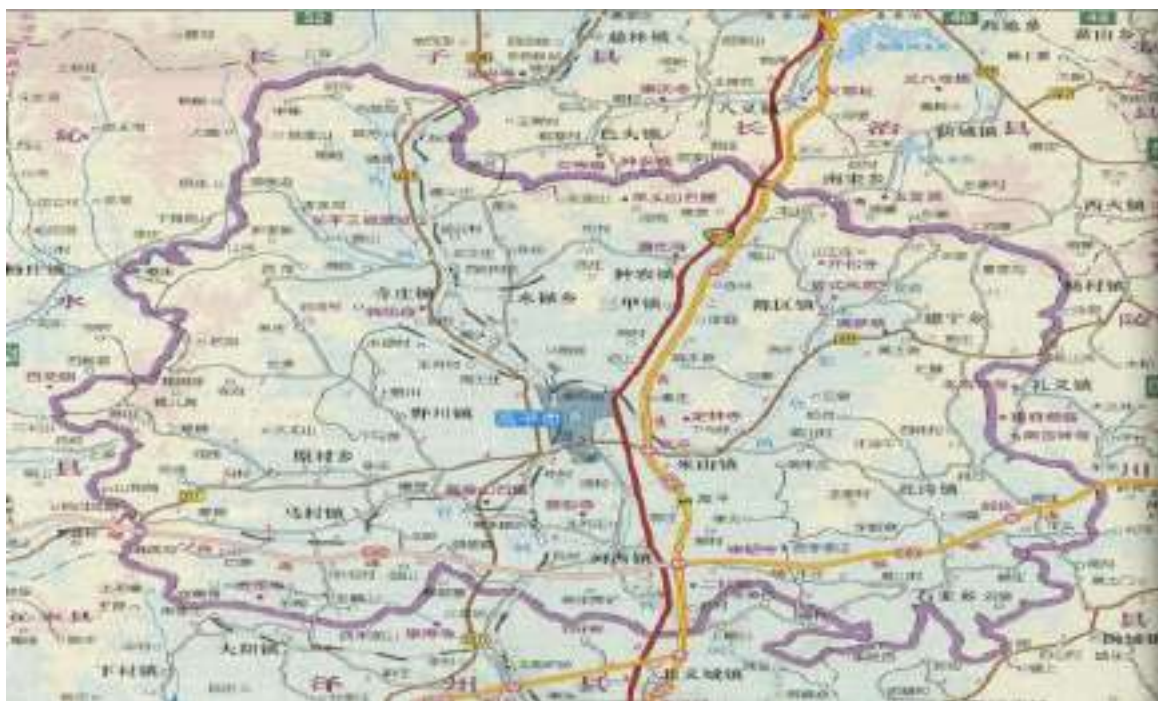
图 1 高平市地理位置图

高平地处丹河上游，是丹河发源地和径流补给区。境内河流属自产外流型水系，无过境水、边界水可供开发利用，是严重缺水地区。据晋城市第二次水资源评价表明：高平本地水资源总量 9943 万立方米，可利用量 5501 万立方米（其中：地下水 3881 万立方米、地表水 2020 万立方米、重复量 400 万立方米）。加上张峰供水工程外调水量 2360 万立方米，高平总计可用水量 7861 万立方米。